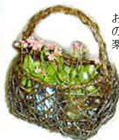
お部屋では水ポット のお花を籠に入れて 楽しんでいます。