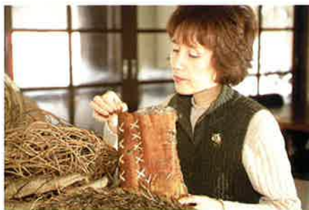
フジの皮を細く糸状にしたものでステッチを施している。 木の皮を使った個性的な作品。