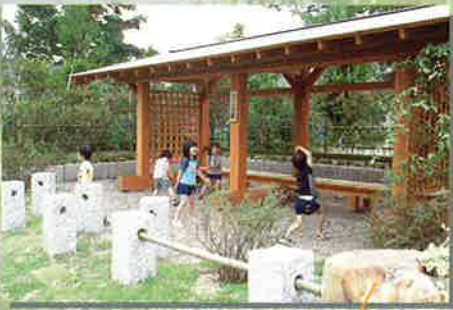
さんぽ駅では子供たちも楽しそう！