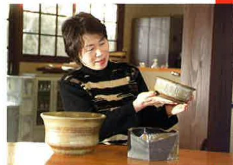
陶芸工房 草宵 潟上市飯田川和田妹川字妹川94 TEL 018-877-2283