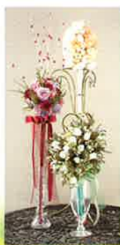
アレンジ工房 アップ 秋田市泉東町2-7 TEL&FAX 018-868-7890 http://akitaup.fc2web.com/